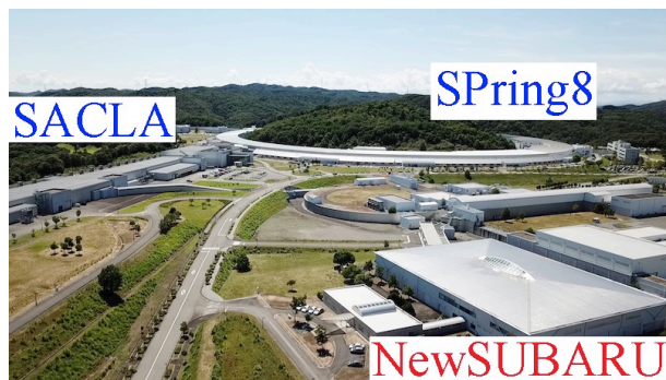
Figure 1: Bird view of NewSUBARU building.

SPring-8 は SACLA からの直接入射に移行予定であり、SPring-8 とニュースバルで共通に使用していた線型加速器の運転停止も予定されている。ニュースバルでは、2020 年の 7 月で利用運転を停止して、8 月より理研の協力のもとニュースバル専用の新しい入射器の設置工事を始めている。