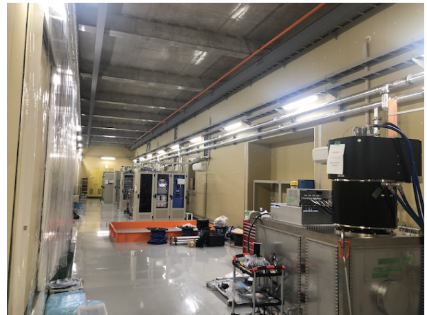
Figure 3: Inside view of new building.

ニュースバル放射光施設は、建設から22年経過しており、経年劣化により、様々な機器故障が増えてきている。点検・機器更新・監視システムの構築等に対応していく必要がある。新しい入射器建設のために加速器の利用運転が停止し、2021年4月に運転再開予定である。