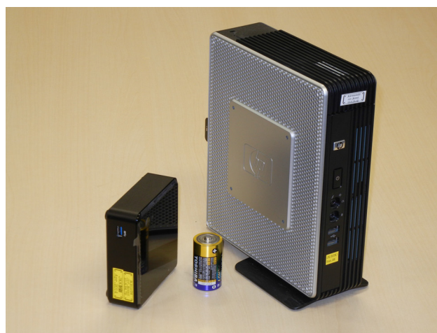
Figure 1: Photograph of HP Compaq t5730 (left), Intel NUC (right), and a D Battery for Size Comparison (center). T5720 is not shown but its appearance is almost same as t5730.

2012 年に SL の配布元による SL4 のサポートが終了したことを契機に、今後 5 年間の運用を見据えて次期端末用計算機を選定した。次期端末の候補として、SSD に 64 ビット版 SL6 をインストールした Intel NUC DC53427HYE を 1 台導入し、2013 年 12 月から 2014 年