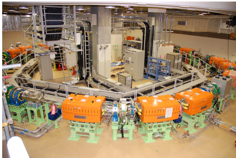
Figure 3: 整備中の加速器の様子